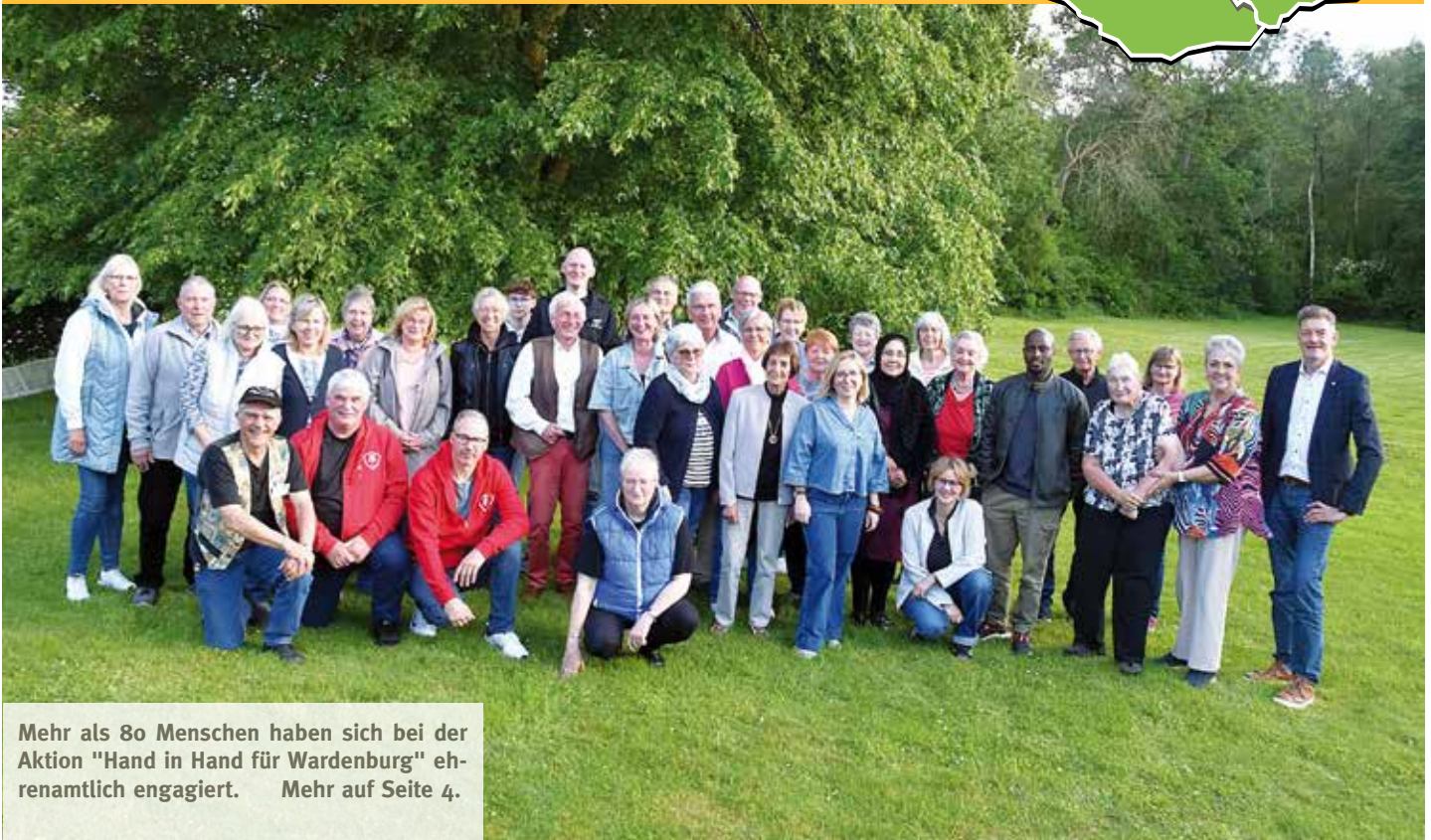
Mehr als 80 Menschen haben sich bei der Aktion "Hand in Hand für Wardenburg" ehrenamtlich engagiert. Mehr auf Seite 4.

Regionale Nachrichten // unabhängig/überparteilich